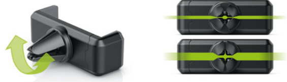
360° drehbare Universal Halte-Kralle für dünne und dicke Lüfter-Lamellen