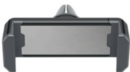
Standard schwarz/grau mit Alu-Frontplatte

Auch diese Version ist mit farbigen Silikon-Backen lieferbar (Standard- und Sonderfarben).