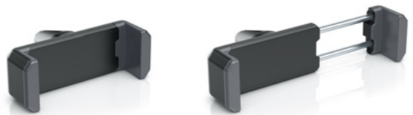
Gefederter Halte-Arm für Smartphones aller Größen

Durch die um 360° drehbare Halte-Kralle lässt sich das Smartphone im Hoch- und Querformat positionieren.