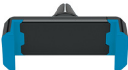
Standard Blau (ca. Pantone 2935 C)